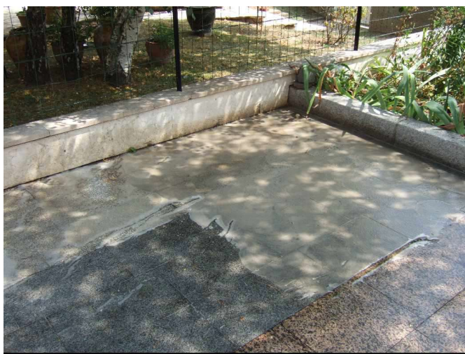
Laisser travailler la mousse durant 10 à 15 mn

Faire mousser abondamment au moyen d'un balai-brosse ou d'une brosse rotative (équipée éventuellement d'un pad sur des pierres tendres).